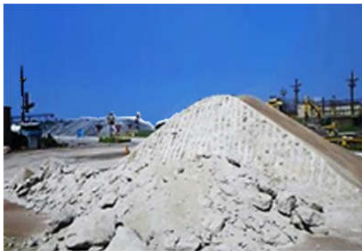
固結防止剤無添加の場合 (保管8週目)

水砕スラグ細骨材の野積み保管時の固結を防止するための薬剤です。本薬剤を添加することにより、これを添加しない場合に比べて顕著に固結を防止することが可能です（下の写真および2枚目を参照ください）。