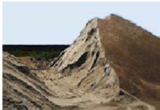
スラグエース 1937 を添加した場合 (保管8週目)